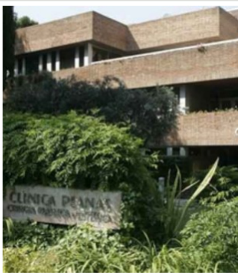
La clínica Planas